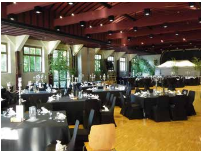
Festlich geschmückte Schützenhalle

Suchen Sie Räumlichkeiten in festlichem Ambiente? Unsere Schützenhalle und die Schützenstube sind dafür bestens geeignet. Von fünfzig bis achthundert Personen sind unsere Räume variabel einsetzbar. Für Rückfragen und Vermietung wenden Sie sich an: