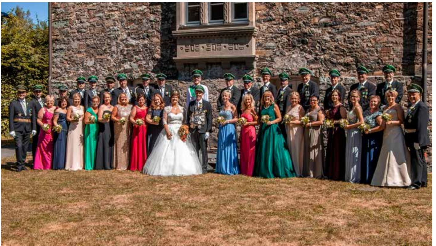
Königspaar 2018/2019 mit Hofstaat